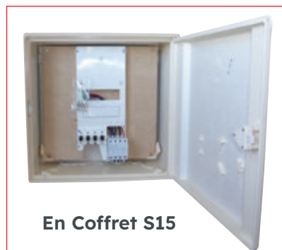
En Coffret S15