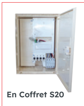
En Coffret S20