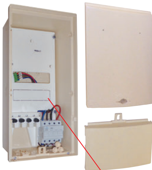
En Coffret CIBE Haut