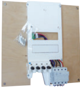
Platine S15 concentrateur (CD074)

Ces produits permettent de mettre en place un coffret avec platine concentrateur sur les socles existants (S15-S20). Cela évite d'installer une borne CIBE spécifique qui nécessiterait un terrassement.